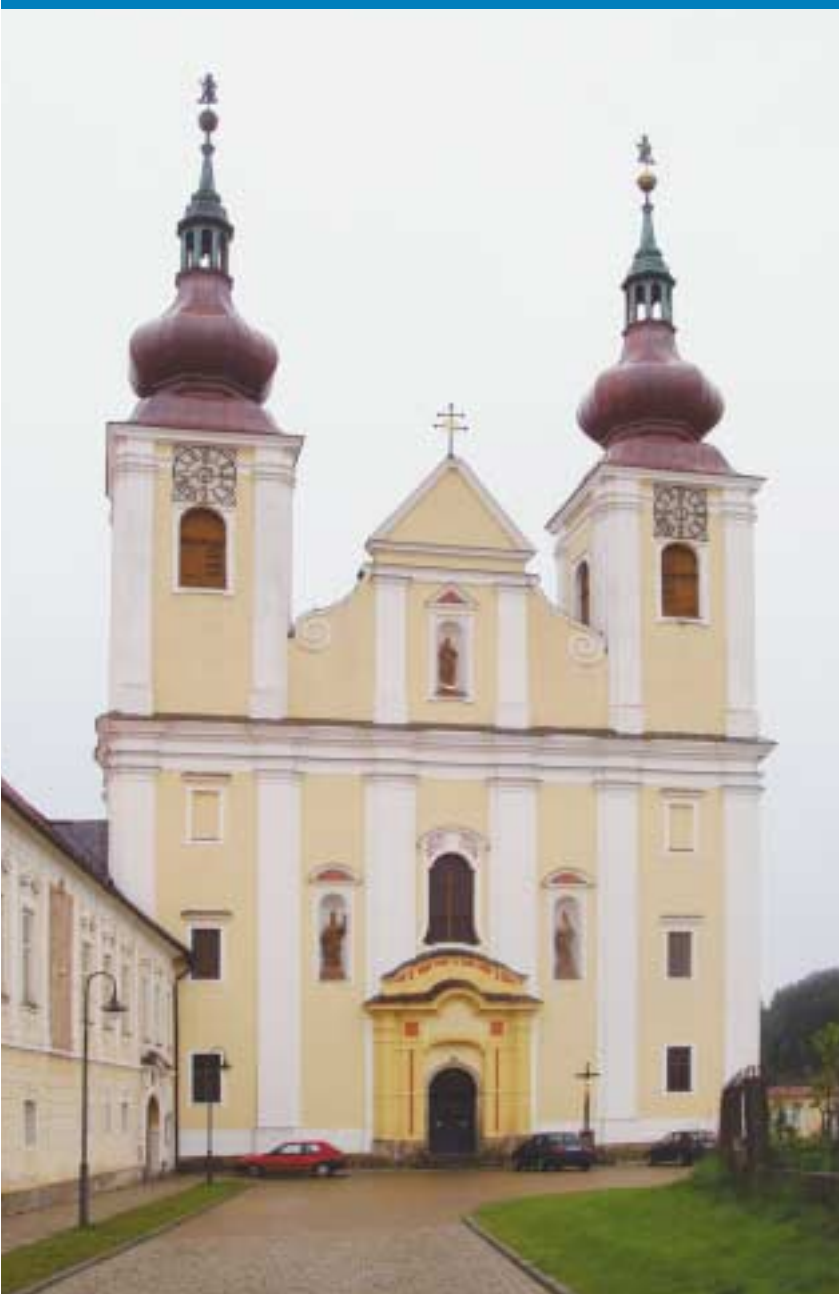
Klášteř premonstrátů v Nové Říši spolu s kostelem sv. Petra a Pavla získávají postupně původní krásu...