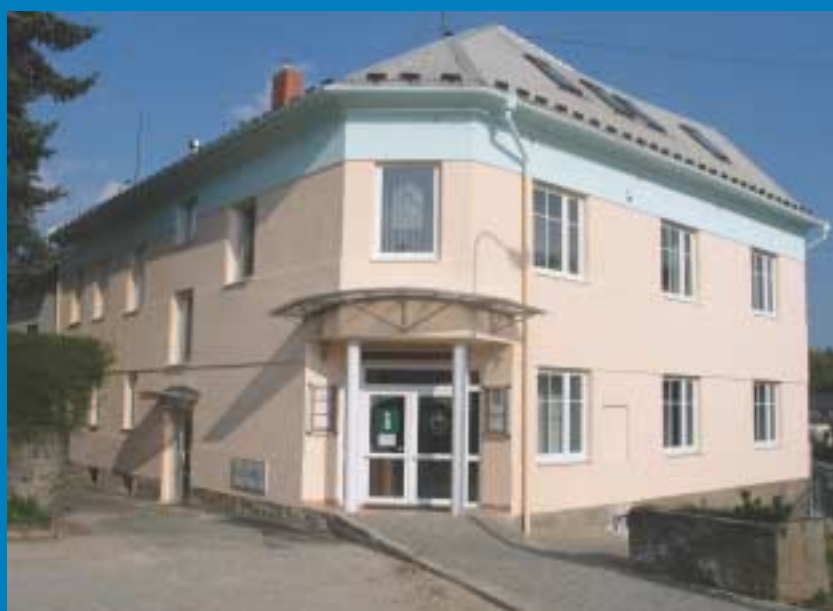
Městská knihovna a informační centrum