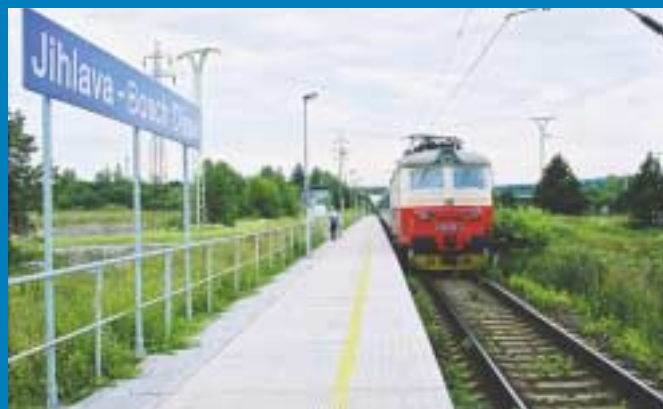
Unikátem kraje je i železniční zastávka, nesoucí nejen místní označení, ale i název firmy, která patří k výrazným investorům v kraji.