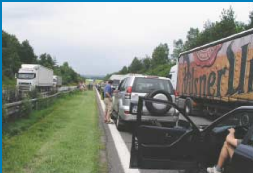
Dálnice D1 - na jedné straně požehnání, na druhé prokletí... Časté havárie způsobují neprůjezdnost, někdy i hodiny stojí bezmocní řidiči v nepojízdné koloně...