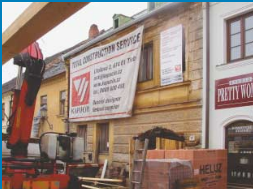
Mnohé památkové objekty dostávají zpět krásnou podobu - na snímku rekonstrukce domu v třebíčském židovském ghettu.