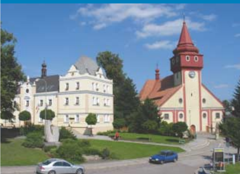
Radnice a kostel sv. Václava

V přilehlém zámeckém parku s rybníky se nachází řada zajímavých prvků drobné architektury, jako altánky, kamenná schodiště a lavičky, ale především ocelový Čertův most klenoucí se nad kamenitou strží. Park prošel v minulých letech rozsáhlou rekonstrukcí a péčí města je udržován pro návštěvníky z města a blízkého i dalekého okolí. Na jeho okraji stojí pomník zakladatele českého skautingu