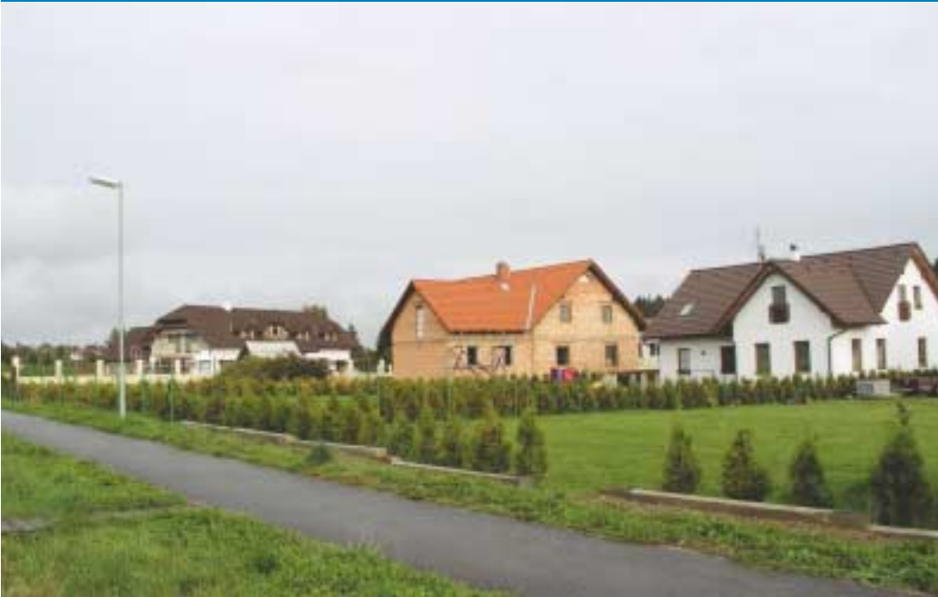
Rozvíjí se i výstavba rodinných domků - tyto stojí na okraji Žďáru nad Sázavou.

Dálnice je velmi citlivé téma - na jedné straně poze- hnání, na druhé prokletí. Kraje, které dálnici nemají, nám ji závidí, protože okolí dálnice evi- dentně přitahuje investory - zmiňme se o investici firmy BOSCH v Jihlavě, s nezaměstnaností nemají problém také v Humpolci, Velkém Meziříčí nebo Velké Bíteši. Na druhé straně, když se podíváte na mapu emisního zatížení, právě největší zatížení je v okolí dálnice a velkou zátěž pocítují zejména občané Velkého Meziříčí. Své by mohli vyprávět pra- covníci záchranných složek našeho kraje, kteří na dálnici zasahují při haváriích - hasiči i zdravotnická záchranná služba.