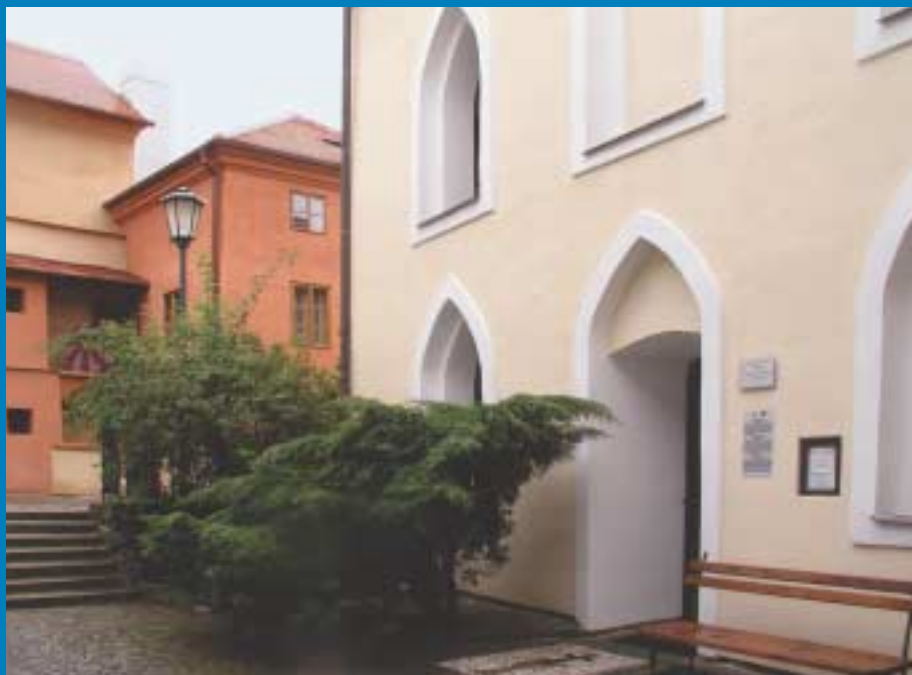
Bazilika sv. Prokopa a židovské město v Třebíči patří mezi památky UNESCO.