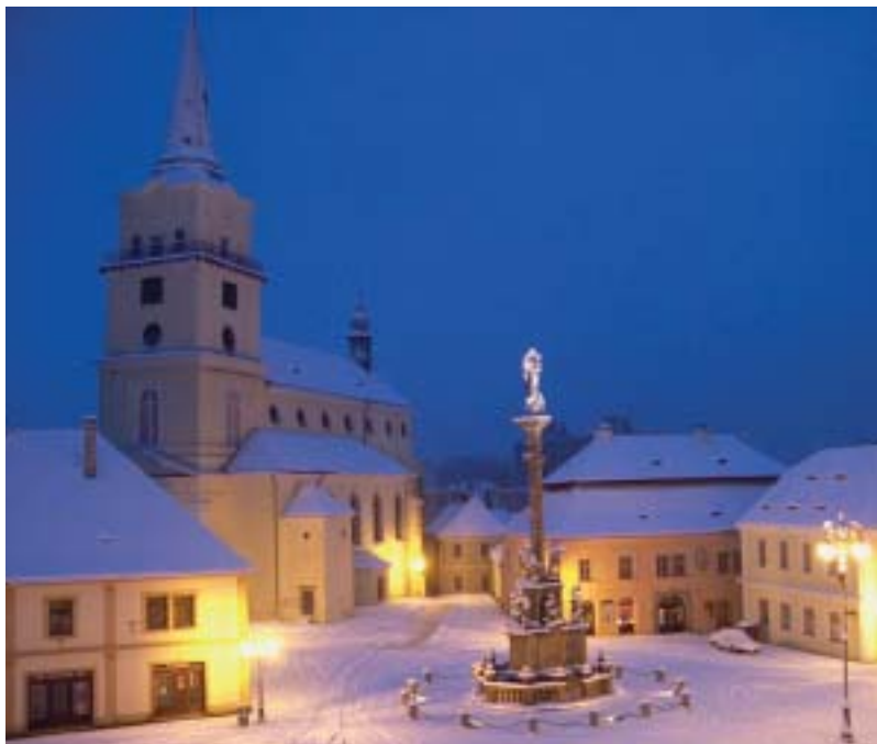
Kostel Panny Marie Sněžné