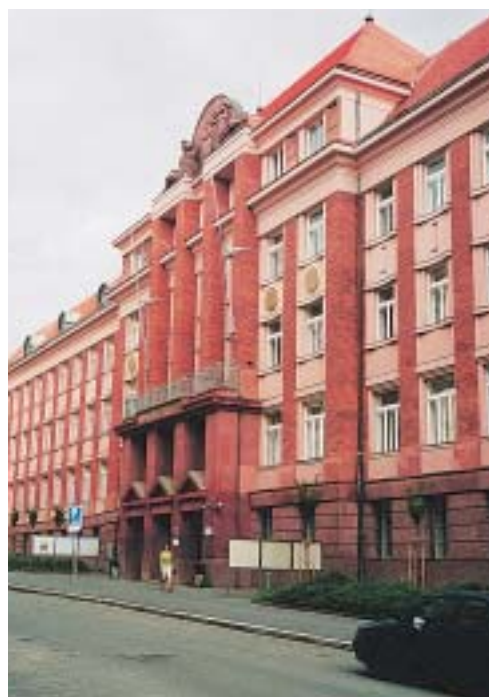
Hlavní průčelí po rekonstrukci