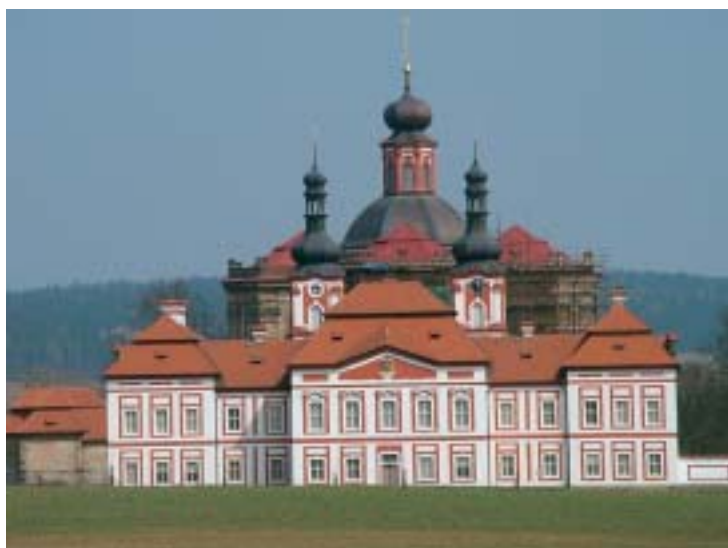
Obnova významné kulturní památky probošství v Mariánské Týnici, dnes Muzeum a galerie severního Plzeňska