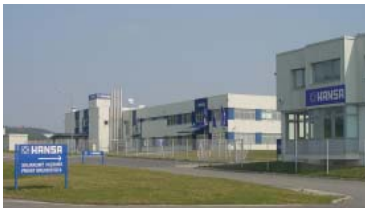
Novostavba závodu HANSA ČESKO, s. r. o., na výrobu vodoinstalačních armatur