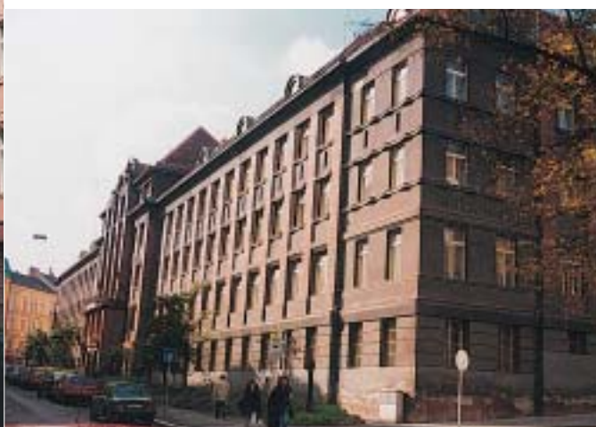
Hlavní průčelí - stav před rekonstrukcí