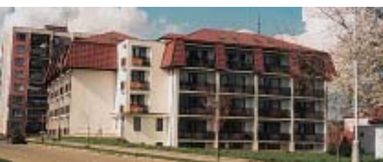
str. 42 – Blovice