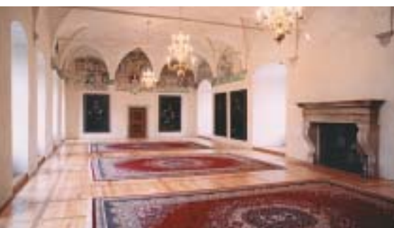
str. 6 – Středověké hrady žijí