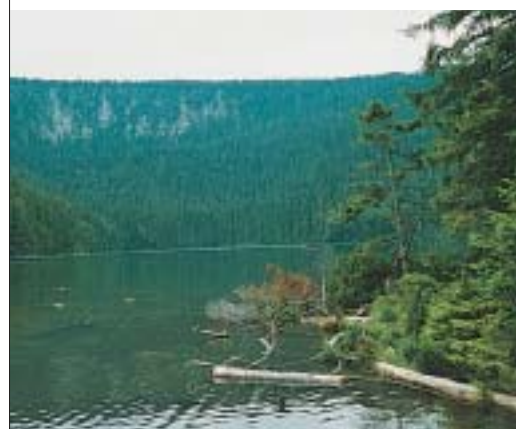
str. 87 – Železnorudsko