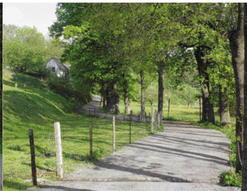
Údolím Ostružné v úseku Nemilkov-Rajský Mlýn je vedena jedna z nejpůvabnějších cyklotras oblasti Velharticka