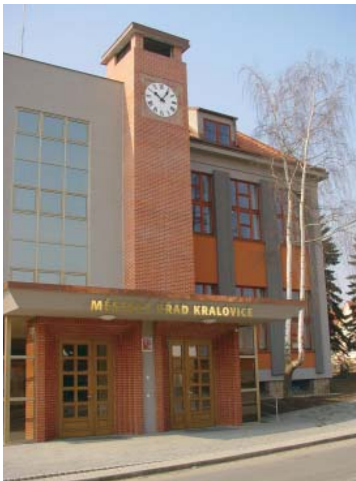
Rekonstrukce budovy předválečného sídla kralovického okresu na městský úřad s rozšířenou působností