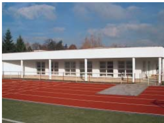
Sportovní areál u ZŠ Čechova