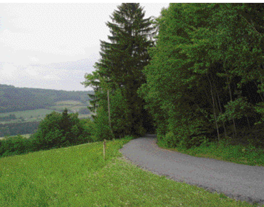
Cyklotrasa Rajský Mlýn-Rajské-Úloh s nezaměnitelným výhledem na údolí Drnového potoka nad Běšinami

cyklotrasy. Na základě „Studie obnovy venkovských cest“, zpracované pro obce mikroregionu Střední Pošumaví v roce 2001, byla v roce 2002 z programu PHARE CBC získána dotace na rekonstrukci pěti vybraných úseků cyklotras v celkové výši 5,5 mil. Kč. Celková hodnota všech projektů činí více než 7 mil. Kč. Poslední stavební úpravy na dotčených komunikacích byly dokončeny v květnu 2003, kdy byly nově upravené úseky cyklotras otevřeny cyklistům. Od letošní sezóny si tak mohou cyklisté doslova vychutnat například 2,4 km dlouhou cestu z Javoří do Velhartic či 2,7 km dlouhý úsek podél Ostružné mezi Nemilkovem a Rajským Mlýnem. Odtud mohou pokračovat po rovněž nově upravené cestě, nabízející krásné výhledy na údolí Drnového potoka, přes Rajské do běšinského Eurocampu. Další opravené úseky se nacházejí na páteřní cyklotrase č. 332 z Běšin do Vrhavče a v okolí Hrádku u Sušice.