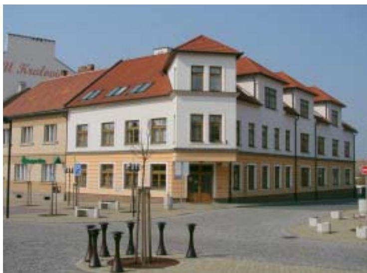
Novostavba budovy finančního úřadu